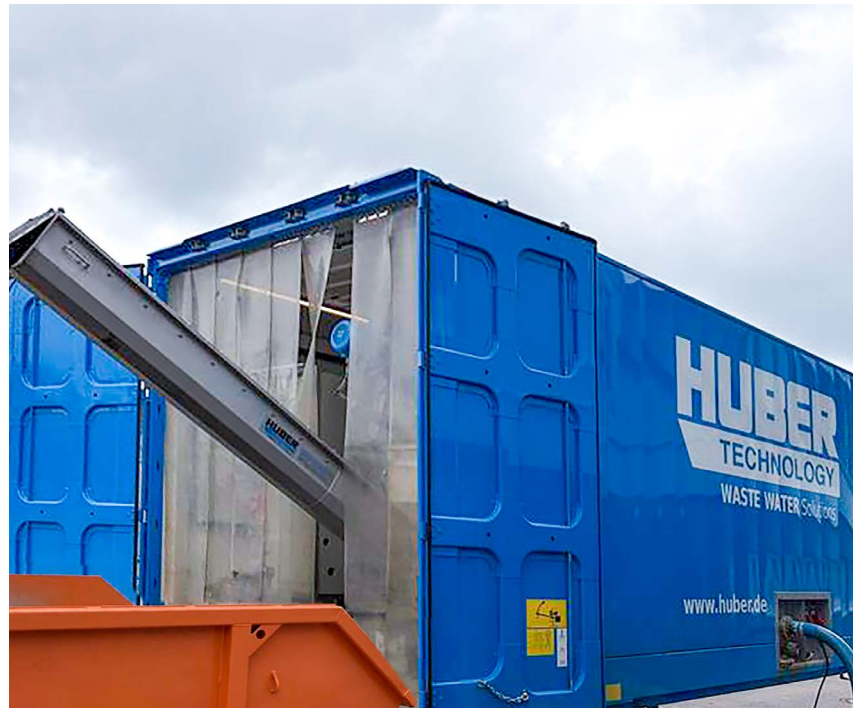
Mietanlage - HUBER Schneckenpresse Q620.2 auf Wechselbrücke